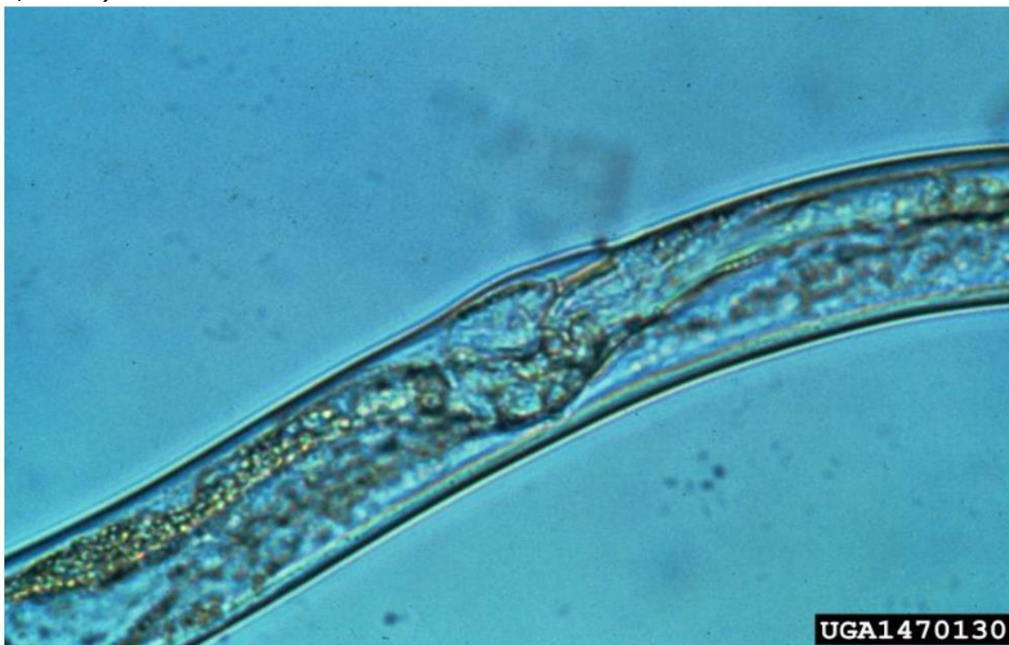
Fig. 2 – Aba vulval da fêmea de B. xylophilus .

Dentro do gênero Bursaphelenchus , vários grupos de espécies podem ser facilmente distinguidas. O grupo "xylophilus" possui como características a presença de quatro linhas laterais, de uma aba vulval (fêmeas) (Fig. 2) e machos com grandes espículas fortemente arqueadas. B. xylophilus mostra características gerais do gênero Bursaphelenchus : nematoides finos, pequenos a longos, com região cefálica alongada, delimitada por uma constrição, com seis lábios e estilete bem desenvolvido, geralmente com pequenos espessamentos basais. Metacorpo bem desenvolvido (EPPO, 2013).