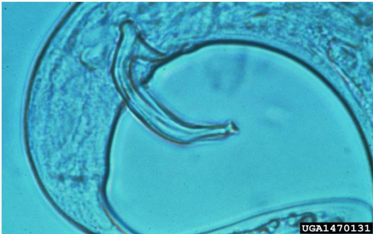
Fig. 3- Espícula do macho de B. xylophilus .

Fêmea: Glândula esofagiana com lobo delgado, medindo cerca de 3 a 4 vezes a largura do corpo. Poro excretor ao nível da junção esôfago-intestino, ocasionalmente no mesmo nível do anel nervoso. Hemizonídio com cerca de 0,67 da largura do corpo, atrás do bulbo mediano. Vulva posterior, localizada no último quarto corporal, com lábio anterior pendurado formando uma aba (aba vulval). Trato genital monoprodélfico, alongado. Oócitos desenvolvidos em fila simples, ou única, em sua maioria. Saco pós-uterino bem desenvolvido. Cauda sub-cilindróide com uma ponta bem arredondada (Fig. 4). Mucro normalmente ausente, mas algumas populações podem ter um mucro bem curto, medindo 1 a 2 \mu\text{m} (CABI, 2013a).