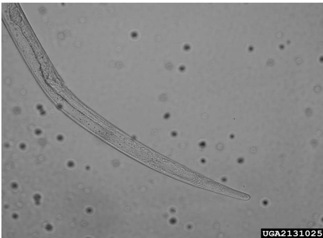
Fig. 4- Cauda sub-cilindróide da fêmea de B. xylophilus .