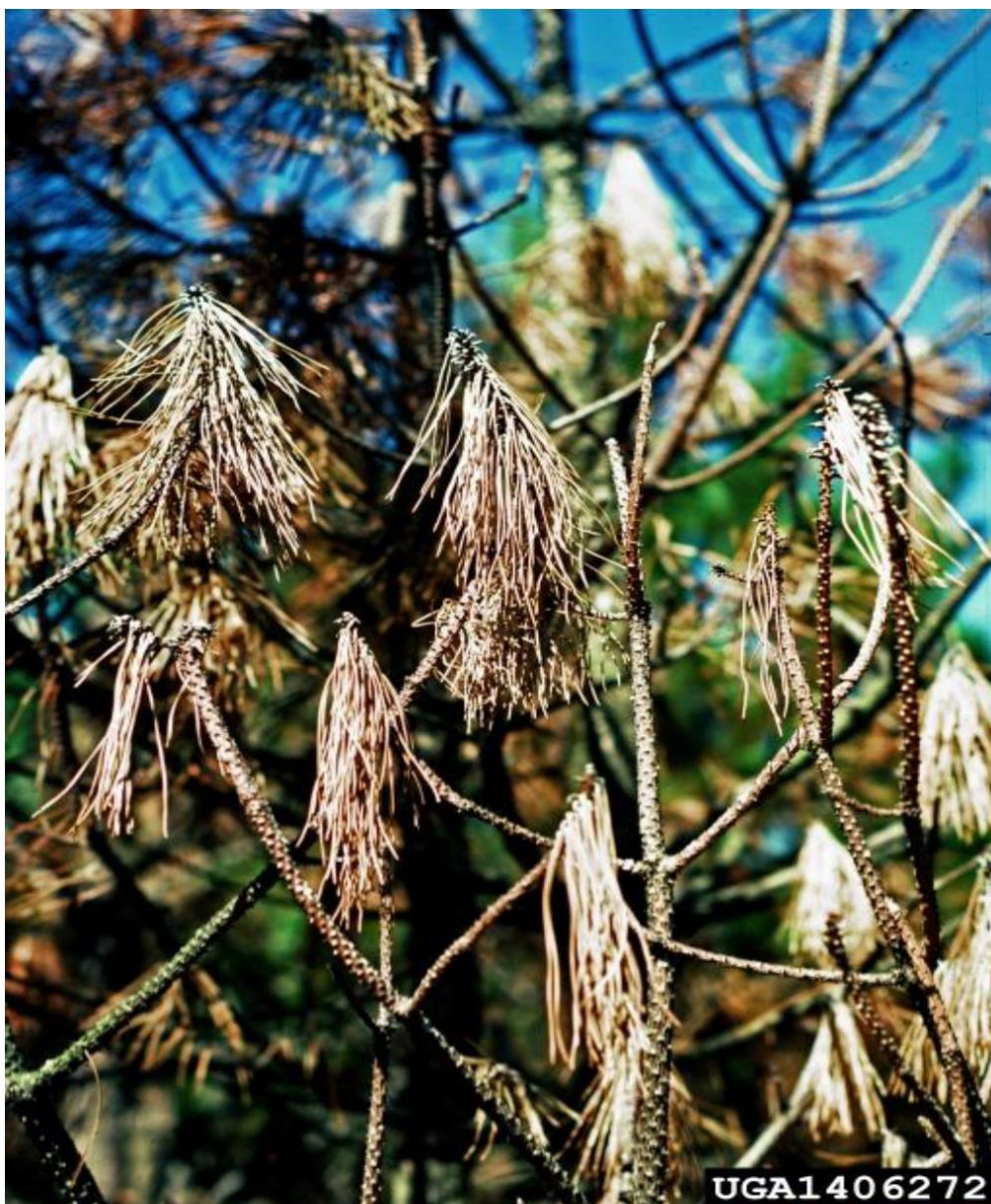
Fig. 7- Danos causados em P. nigra .