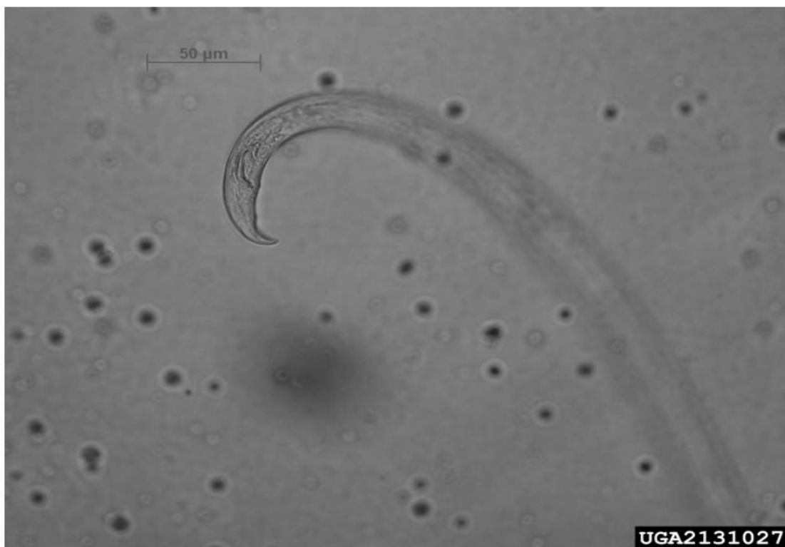
Fig. 5- Cauda do macho de B. xylophilus .